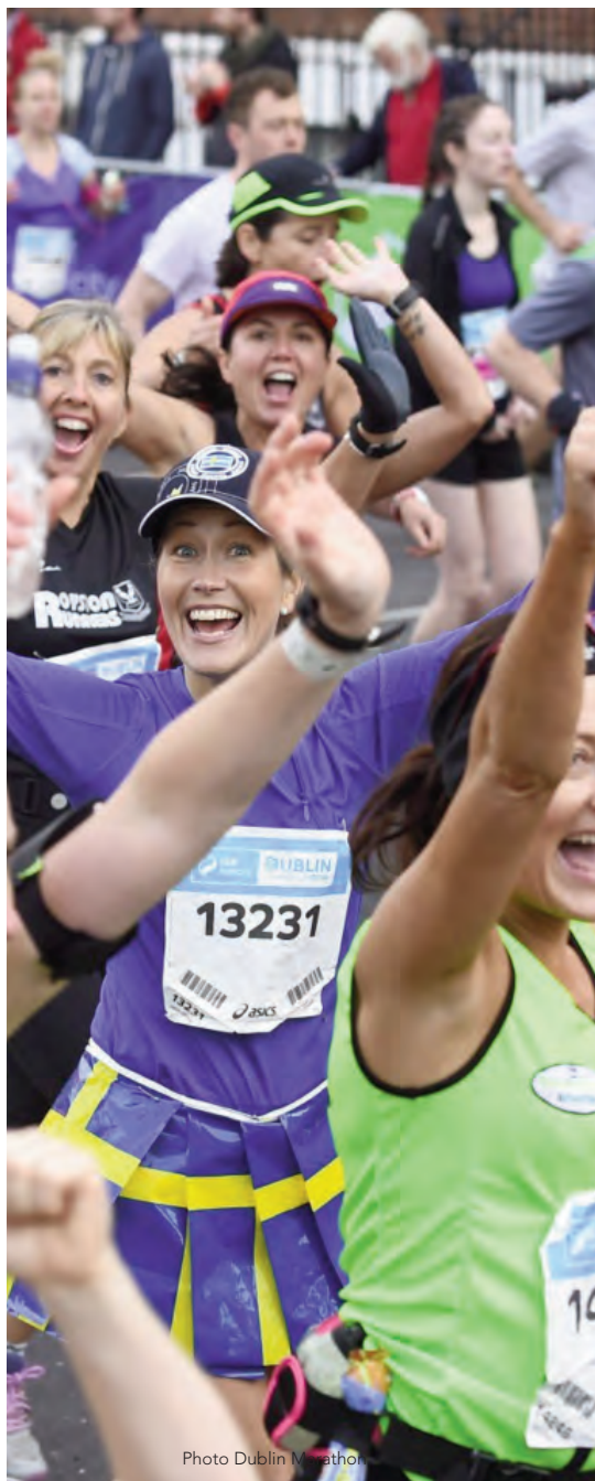
Photo Dublin Marathon

L' hospitalité Irlandaise n'est pas un mythe ! la très bonne humeur et l'enthousiasme des milliers de spectateurs massés le long des rues Géorgiennes de la ville pour l'événement ont été largement responsables du succès du marathon à travers les années. Il n'est donc pas étonnant que le Marathon de Dublin, outre le fait qu'il se situe parmi les grands marathons Européens, soit internationalement connu comme étant le «Marathon sympa».