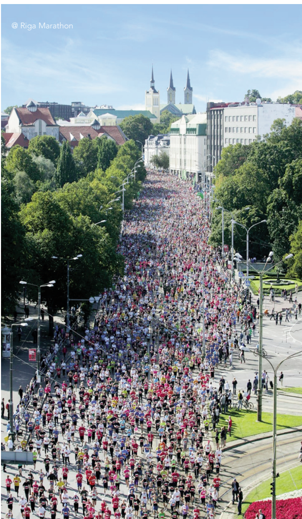
@ Riga Marathon